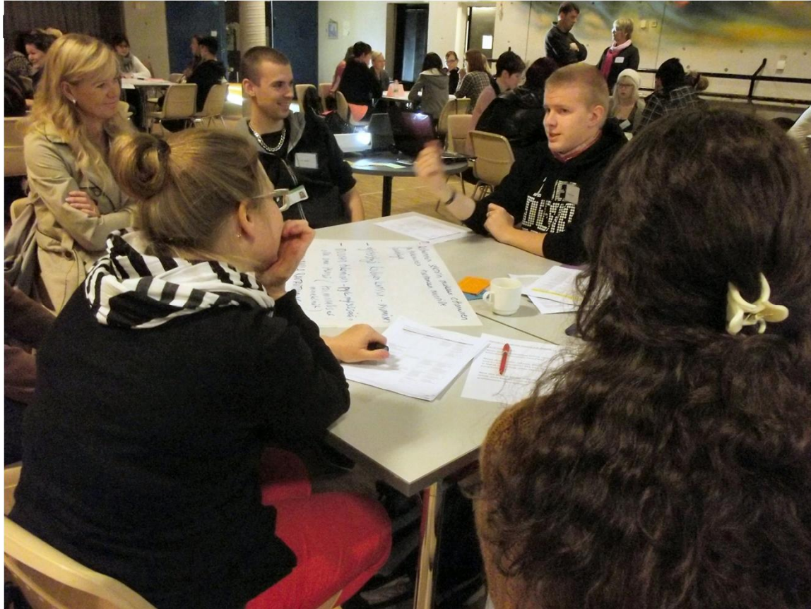
Ideointiprosessi jatkuu.... (työpaja 24.9.2012)